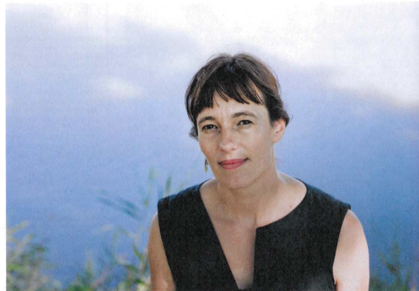
'De voorbije jaren liet ik mensen voor een ritueel betalen wat ze het zelf waard vonden. Toch even schrikken: hebben mensen dan echt niet zoveel over voor zingeving?'

'Er kruipt inderdaad veel werk in. In de afgelopen drie jaar liet ik mensen ervoor betalen wat ze het zelf waard vonden. Die aanpak maakte deel uit van mijn onderzoek naar het